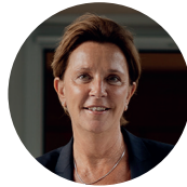
Yvonne Gebauer Yvonne Gebauer MdL Sprecherin für Kultur