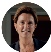
Yvonne Gebauer Yvonne Gebauer Mdl Kulturpolitische Sprecherin der FDP-Landtagsfraktion